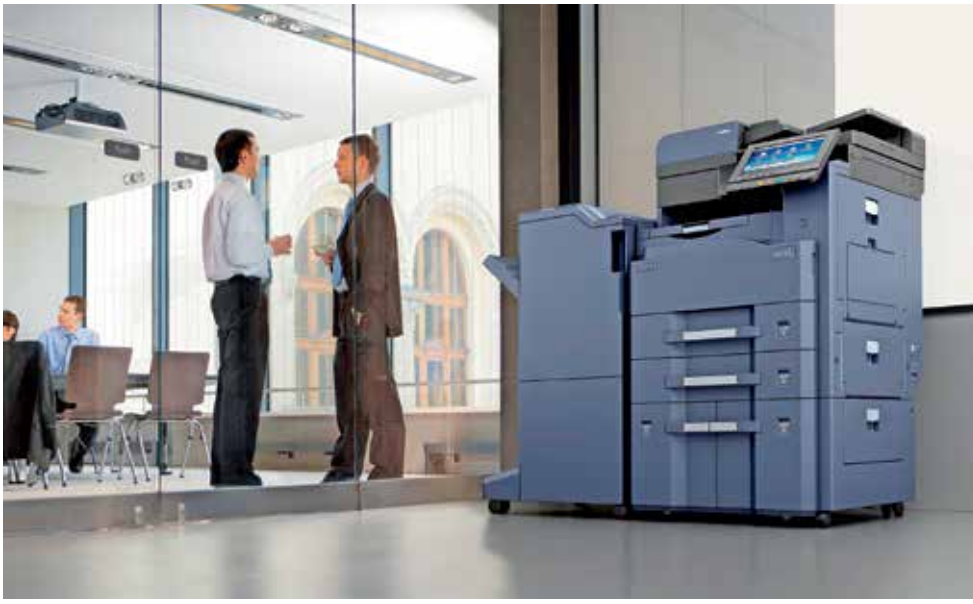
■ Pri tiskanju kot storitvi podjetje mesečno plačuje le dejanske stroške tiskanja, za vzdrževanje pa skrbi ponudnik.

Boljši recept, za katerega se zadnje desetletje odloča ogromno podjetij, je tiskanje kot storitev, kjer podjetje tiskalniško okolje preda v zunanje iz-