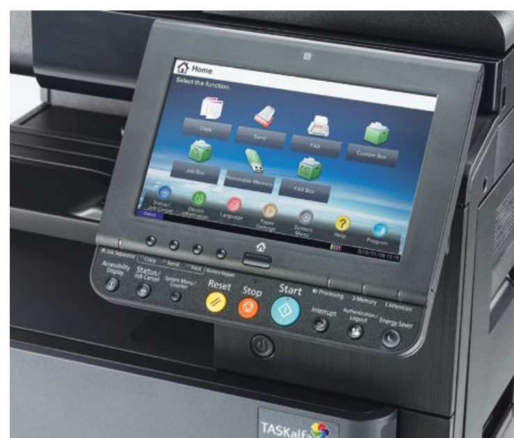
Večopravilne naprave nadomeščajo klasične tiskalnice.

A podjetja pri pregledu ponudb celovitih rešitev upravljanja tiskanja še vedno iščejo predvsem podatka o ceni izpisa na črno-belo ozroma barvno stran. Najzahtevnejša okolja, ki morajo vsak mesec v kratkem času izdati velike količine dokumentov, pa zanima še podatek o hitrosti tiskanja. A glede na dejstvo, da večina sodobnih naprav zmore v minuti natisniti od 20 do 60 strani, je hitrost tiskanja za povprečno podjetje sekundarnega pomena.