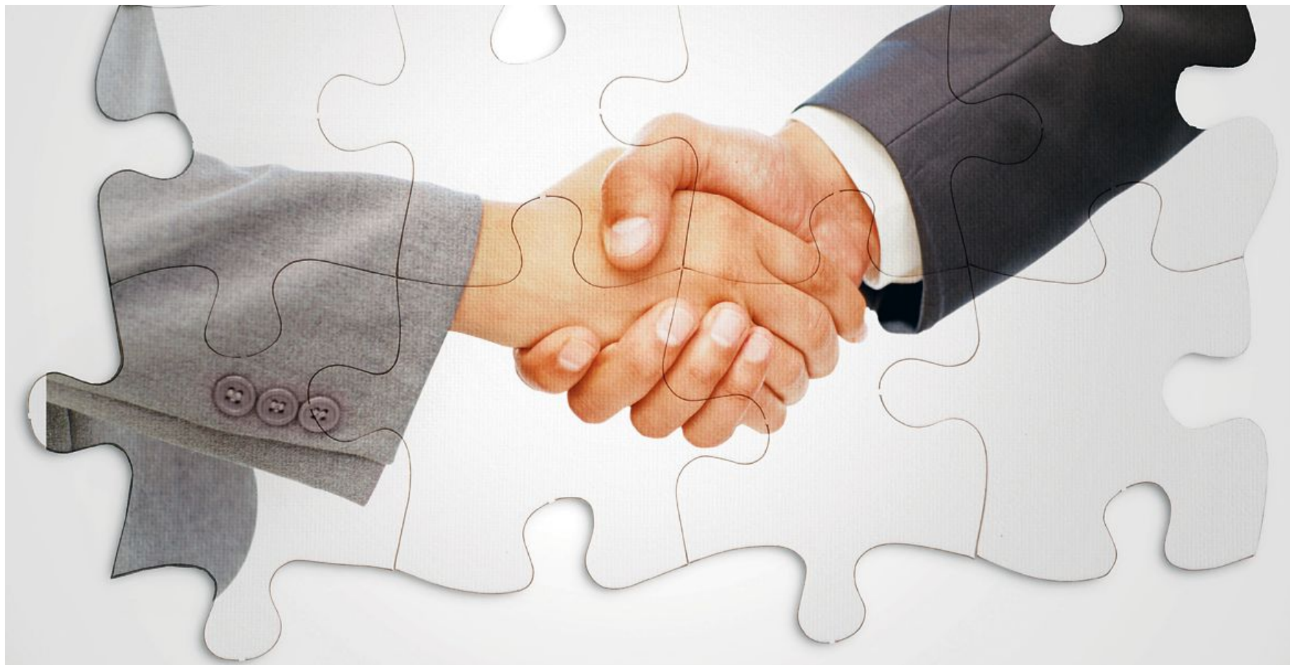
Tudi pri digitalni preobrazbi je cilj dosežen uspeh.

Vse lepo in prav. Zgoraj naštetih pristopi sicer res vodijo do delnega