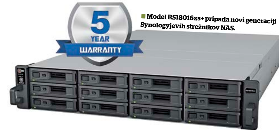
Model RS1016xs+ pripada novi generaciji Synologyjevih strežnikov NAS.

Pred kratkim je Synology predstavil skalabilen in visoko razpoložljiv strežnik NAS za zahtevna poslovna okolja. Model RS1016xs+ pripada novi generaciji strežnikov NAS, skupaj z razširjenimi enotami RX1216sas pa ga je možno nadgraditi na več kot 1,4 petabajta (PB) prostora za hrambo podatkov. Za izjemno hitro delo s podatki skrbi zmogljiv štiri jedrni procesor Intel Xeon, ki obvlada kriptiranje podatkov v realnem času na vseh 12 pogonih, vgrajenih v strežnik. Zmogljivosti so za ta tip naprave ekstremne, saj lahko uporabnik zagotavlja stabilne prenose več kot 3.900 megabaj-