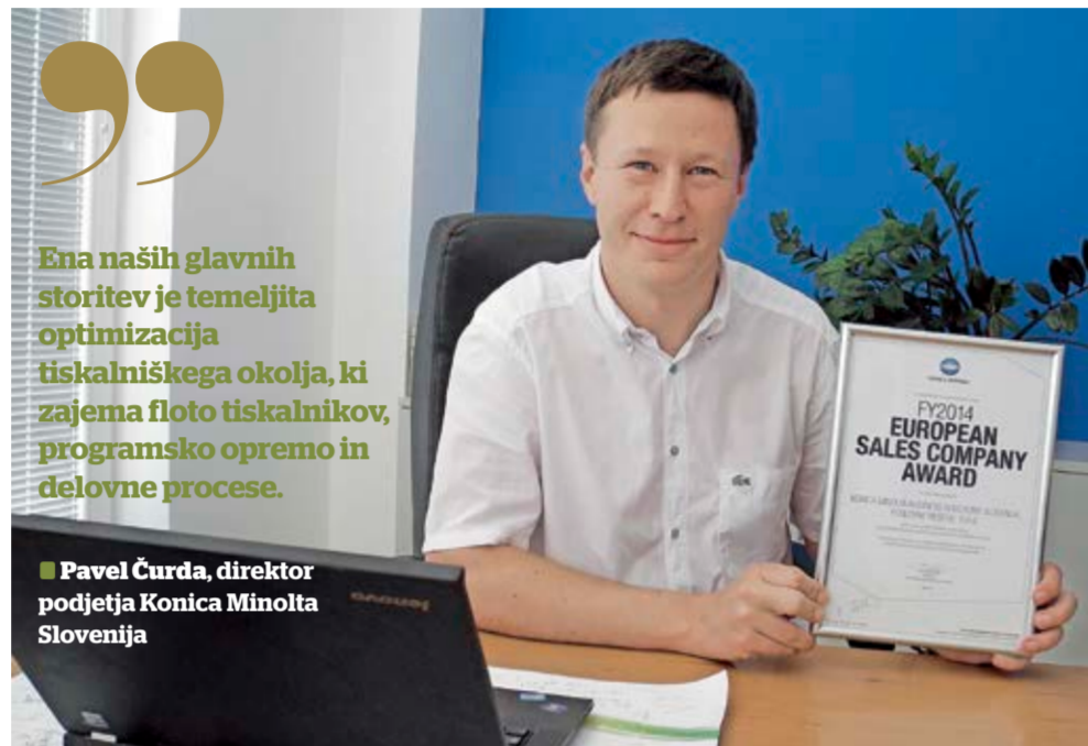
Ena naših glavnih storitev je temeljita optimizacija tiskalniškega okolja, ki zajema floto tiskalnikov, programsko opremo in delovne procese.

Predvsem me veseli, da smo vodilni na izjemno konkurenčnem trgu. Takšna konkurenca nas dela še močnejše. Laično bi lahko ugotovili, da so sami tiskalniki in večopra-