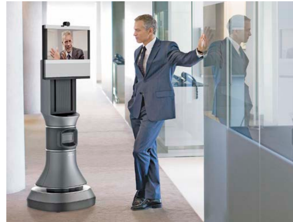
Robot AVA 500 na zaslonu prikazuje sliko človeka na drugi strani komunikacije in se lahko po prostoru premika skupaj s sogovornikom.

Čeprav bi ga po zunanji podobi lahko krstili tudi za »zver«, je HP Zvr vendarle praktičen sistem, ki v poslovna okolja prinaša razsežnosti navidezne resničnosti. Delo z njim spominja na delo z resničnim hologramom. Praktično sejemski predstavitev je obsegala manipuliranje z različnimi vsebinami, seciranje žabe,