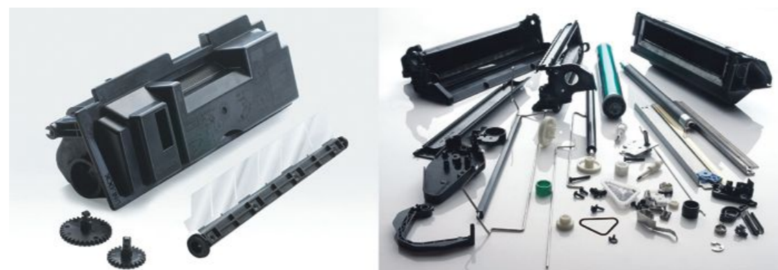
Kyocera brezketna tehnologija in sestavni deli kasete običajnega tiskalnika FOTO XENON FORTE

»Originalni izdelki Kyocera dosega standard eko značke Blue Angel, kar pomeni, da ne vsebujejo škodljivih elementov, kot so na